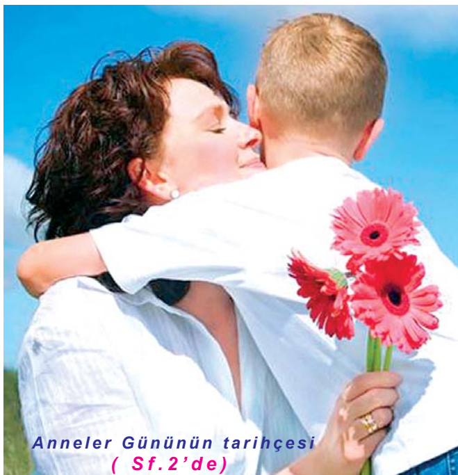
Anneler Günü'nün tarihçesi ( Sf. 2'de)