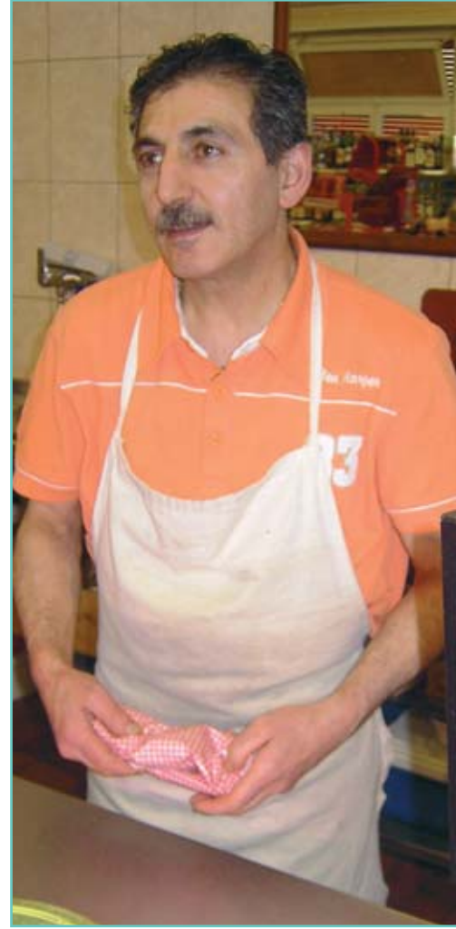
Ben krizi arıyor ama bulamıyorum.