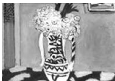
Yılın en pahalı tablo: "Sarı Çuha Çiçekleri."

2009 Uluslararası Sanat Müzayesinde Henri Matisse tarafından yapılan "Sarı Çuha Çiçekleri" 53.4 million frank değer verilerek yılın en pahalı tablosu seçildi.