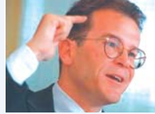
Federasyon Avukatı Valentin Roschacher

Çarşamba günü, 5 Eylül'den itibaren; İsviçre'nin gündeminde Blocher'in federasyon avukatı (Bundesanwalt) Valentin Roschacher'i nasıl görevden el çektiğini haberi yer alıyor. Adalet bakanı Blocher'a