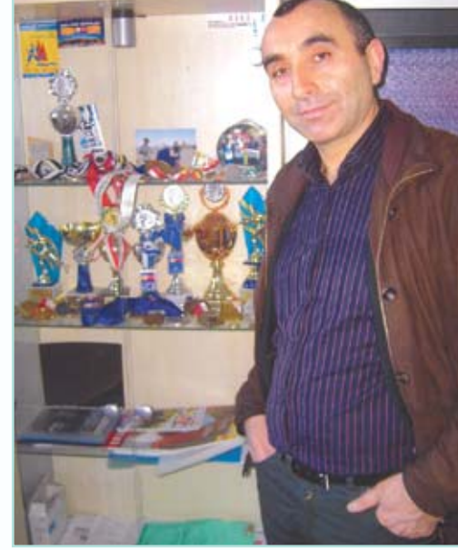
Avrupa 2008 Futbol şampiyonasının önemli maçları İsviçre'de yapılacak, Türkiye ve İsviçre milli takımları arasındaki maç haziran ayında

Bu sporu yapmak isteyen ve koşmak isteyen bir insan, öncelikle 6 aylık bir süre boyunca , her hafta 50 ile 70 Km . arasında antreman koşusu yapmalıdır. Daha sonra ilgili koşulara müracaat ederek yarışmalara katılabilirler.